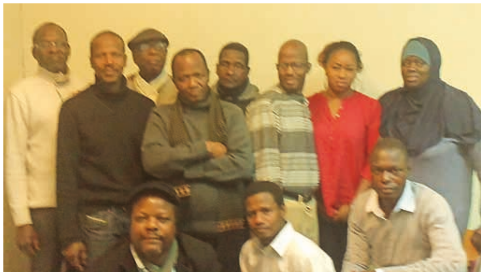
Les membres du bureau de l'association

Pour cela, nous avons recruté un chargé de mission à Kéniéba afin de mieux conduire le projet sur les trois années à venir.